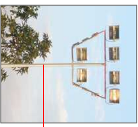
Poste em concreto circular